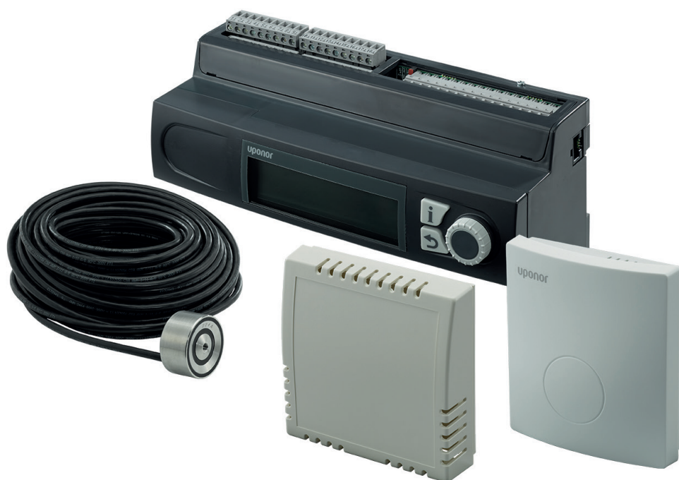
Smatrix Move PRO med funktioner for sne- og ismelting samt varmt brugsvand

Smatrix Move PRO er en avanceret kontrolenhed, der kan anvendes som „stand-alone“ eller i kombination med Smatrix Base PRO. Specielle sensorer aktiverer styringen af fremløbstemperaturen i flere zoner ved varme og køling og endda i snesmeltningzoner udendørs. Det har aldrig været nemmere at bevæge sig mod fremtiden, da Smatrix Move PRO kan integreres i allerede eksisterende CTS systemer via KNX-protokol eller som „stand-alone“ Modbus-RTU RS 232.