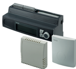
Smatix Move PRO - Vejrkompareret regulering af fremløbstemperaturen i varme anlæg