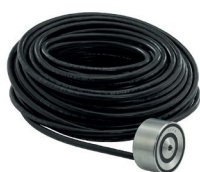
Sne- og issmelting