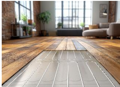
GF_BFS_Siccus_16_Ambience

Con Uponor Siccus 16, los instaladores pueden modernizar con confianza los edificios mediante un sistema radiante de baja altura y alta eficiencia que simplifica la instalación a la vez que maximiza el rendimiento.