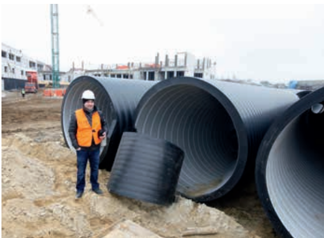
Rury strukturalne Weholite z PE-HD przygotowane do budowy kanału retencyjnego na os. Krakowska Południe w Rzeszowie

Retencyjny kanał ściekowy służy do magazynowania i odprowadzania ścieków deszczowych, a jego zaletą jest możliwość efektywnego wykorzystania całej przestrzeni retencyjnej kanału. Obserwacje przepływu ścieków dowodzą, że nawet podczas ekstremalnych opadów kanały ściekowe mogą nie być całkowicie wypełnione, co generuje pewien niewykorzystany zapas przepustowości hydraulicznej. Rozwiązanie to wykorzystuje tę przepustowość do okresowego retencjonowania ścieków deszczowych. Retencjonowanie odbywa się zwykle w kanałach, które tworzą rury o standardowych średnicach, o odpowiednio wyliczonej i powiększonej kubaturze wewnętrznej. Dodatkowo ich przestrzeń wewnętrzna podzielona jest na komory przez przegrody z otworami przepływowymi, zlokalizowanymi w dolnej części kanału. Rozstaw przegród oraz wielkość otworów przepływowych jest każdorazowo wyliczana za pomocą specjalistycznego oprogramowania komputerowego, które uwzględnia szereg czynników i danych wejściowych. Zalecane jest także wykonanie przelewów awaryjnych w górnej części przegrody z uwagi na możliwość zrzutu nadmiaru ścieków do kolejnej komory, co zabezpiecza obiekt przed ciśnieniowym działaniem. Co istotne, retencyjny kanał ściekowy spełnia jednocześnie dwie funkcje w systemie kanalizacyjnym: