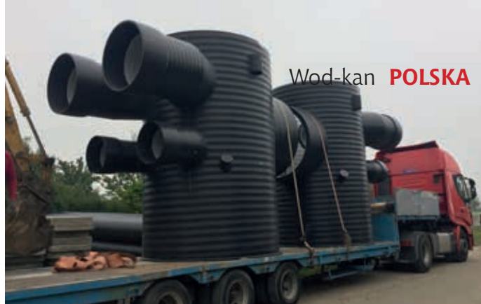
Dostawy elementów retencyjnego kanału ściekowego na os. Budziwój w Rzeszowie