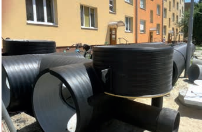
Budowa retencyjnego kanału ściekowego w Mielcu

hydrauliczną, związaną z transportem określonego strumienia ścieków, i retencyjną, umożliwiającą gromadzenie okresowego nadmiaru dopływających ścieków deszczowych ze zlewni.