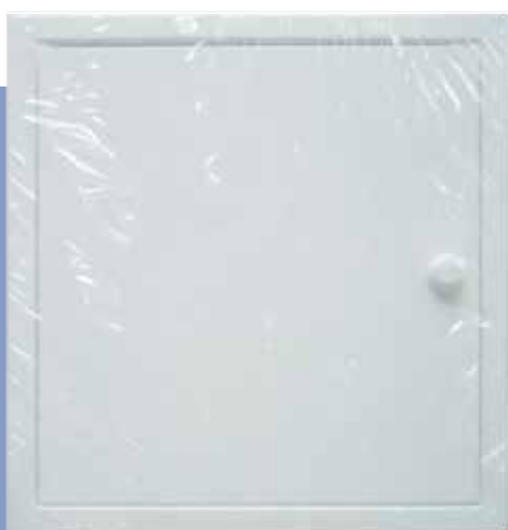
In Schrumpffolie verpackt

UNIVERSELL - Aushängbares Türblatt für Rechts- und Linksanschlag