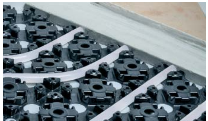
Kratko vrijeme zagrijavanja zahvaljujući tankom samonivelacijskom sloju

Nivelacijski sloj snažno prijanja za ploču zahvaljujući otvorima na ploči.