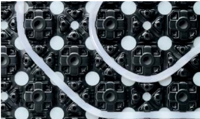
Ugradnja Uponor PE-Xa cijevi pod kutom od 45°

Izbočeni elementi na Minitec ploči sprječavaju pomicanje cijevi i osiguravaju usklađenost cijele konstrukcije prema svim postojećim normama.