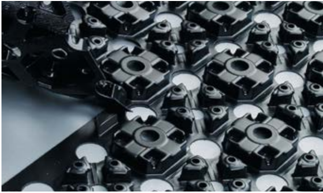
Jednostavna ugradnja Minitec ploča

Ljepljiva površina za sigurno pričvršćenje na pod.