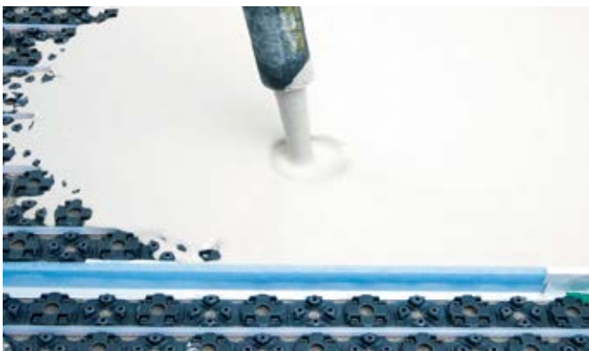
Lako nanošenje nivelacijskog sloja

Čvrsto učvršćenje cijevi omogućuje jednostavnu zavojitu ugradnju kojom se prekriva i grije cijela površina poda.