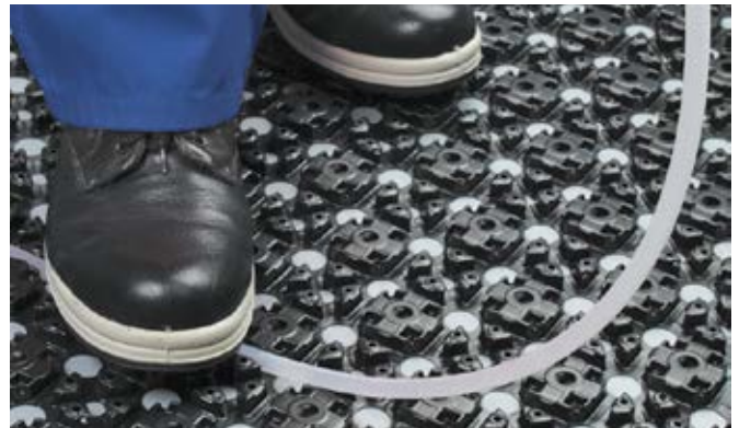
Isplativa ugradnja bez ičije pomoći

Sustav je opremljen posebno osmišljenim pločama za polaganje cijevi pod kutovima od 90° i 45°.