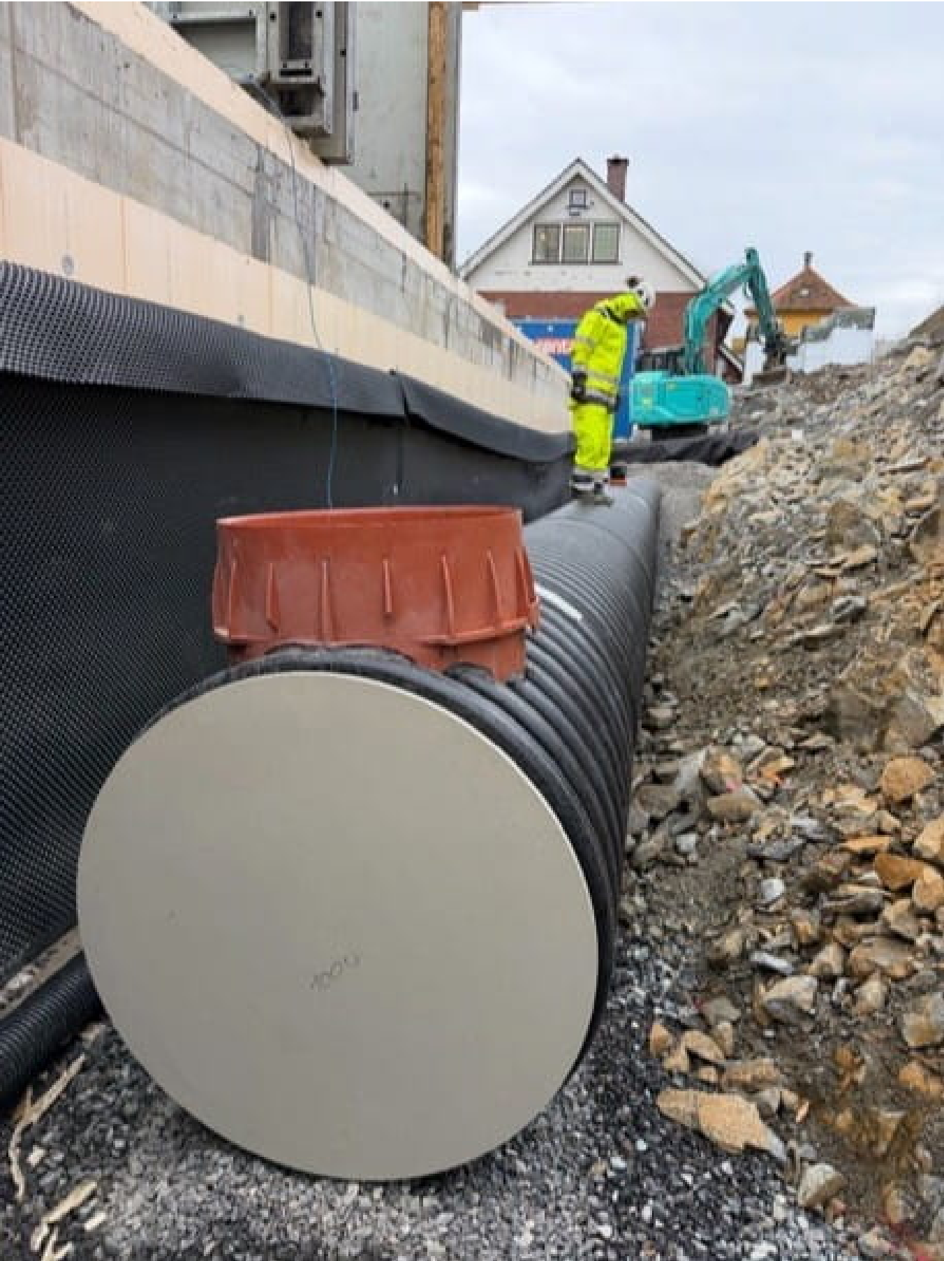
Bilder fra prosjektet